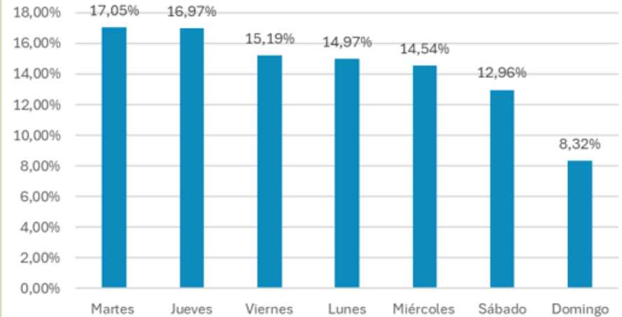
Días con más robos- Enero a Junio 2025

En contraposición, los domingos fueron los días con menor actividad delictiva alcanzando un 8,3% total en el semestre.